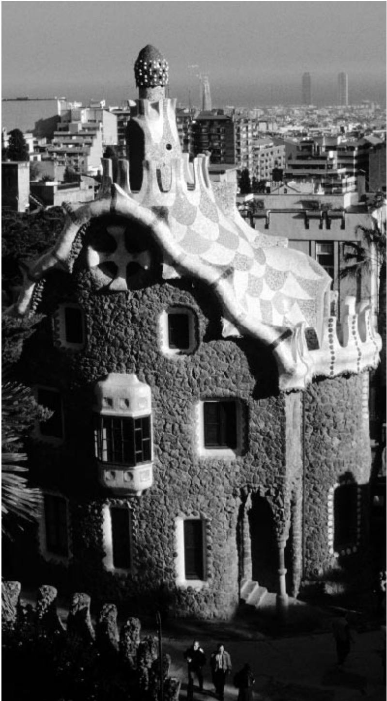
Barcelona, parc Güell.